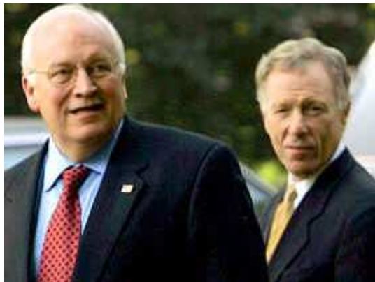
den allra bästa nyhetskällan i frågan

Nyhetera duggar just nu så tätt, att jag kommer att ha den här bloggen som en löpande uppdatering av det allra senaste (senaste nyheten först). Om du vill ha en sammanfattning av allt jag skrivit om ämnet, klicka här så får du se alla artiklar i ämnet, med den här överst: