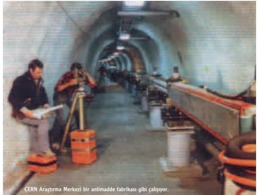
CERN Araştırma Merkezi bir antimadde fabrikası gibi çalışıyor.

mek için önce hemen hemen hiçbir şeyden oluşan protonlar üretilmesi gerekiyor. Sonra "boşluktan" antimadde elde etmek için muazzam miktarda enerji harcanması gerekiyor. CERN araştırmacıları bir "proton-senkrotronu"u, yani protonları neredeyse ışık hızına yakın hızlara ulaştıran bir hızlandırıcıyla, on santimetre uzunluğunda ve üç milimetre kalınlığında bir iridyum çubuğa yönlendiriyorlar. Bu işlemin sonunda birçok parçacık ve antimadde açığa çıkıyor. Devasa manyetik alanlarla sınırlanmış 27 kilometrelik