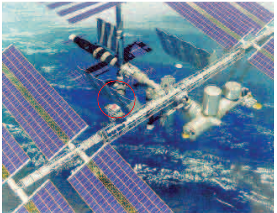
Ululararası Uzak İstasyonu'nda kullanılan Alfa Manyetik Spektrometresi evrende antimadde arıyor

Anti-hidrojen kullanımında neredeyse sınırsız bir enerji, çok küçük bir alana depolanabilir. Diğer enerji biçimlerinin tersine, bir anti-hidrojen tankı mikroskopik ölçüde küçük fakat bir aracı uzun süre çalıştırabilir. Pentagon, "Devrimci Mühimmat" bölümü başkanı Kenneth Edwards, "Bu gerçekleştiğinde saf enerji elde etmiş olacağız" diyor. "Bu aynı zamanda en temiz ve çok ucuz bir enerji kaynağı olacaktır" Bir küp şeker kadar yakıt, 100 tonluk bir aracı uzaya fırlatmaya yetecektir. Böyle bir enerjiyle insansız gözlem uçaklarını sürekli havada tutmak mümkün olduğu gibi Mars'a insanlı uçuşlar yapmak da çok kolaylaşacaktır. Edwards'a göre bir anti-madde motorunun prototipi için daha 15 yıla ve 2 milyar dolara ihtiyaç var. Güvenli bir yakıt maddesi elde etmek için gereken, anti-hidrojenin mutlak sıfır noktasına kadar (-273 santigrat derece) soğutulması. Böylece bu tuhaf buz topunun atomları normal maddeyle reaksiyona giremeyecek kadar soğumuş olacaktır.