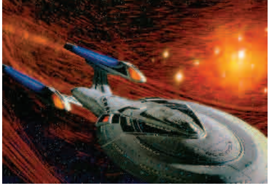
Antimaddenin büyük ölçekte üretilmesinin ve saklanabilmesinin başarılması bize bilimkurgu filmlerindeki gibi uzay gemileri yaparak uzayda yolculuğa çıkmamızı sağlayabilir.

Antimadde araştırmaları ve üretme çabaları sürüyor. Fizikçiler gözlerini maddenin içlerine ne kadar dikeyorsa, kozmologlar da onların dikkatini o kadar uzaya çekiyorlar. Bilim adamları evrenin uzak bir köşesinde Büyük Patlama'nın cehenneminden arta kalmış bir antimadde gaz kümesi kalıntı-