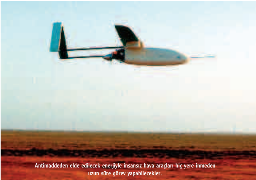
Antimaddeden elde edilecek enerjiyle insansız hava araçları hiç yere inmeden uzun süre görev yapabilecekler.

Kaynak: Scheppach, J., Wir Jagen den Vatikan in die Luft mit Antimaterie, P.M Magazine, Mai, 2005